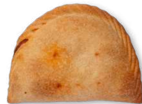
Atún Carne Cebolla carmelizada y queso de cabra