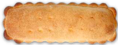
Atún Carne Pollo

Para completar nuestra gama de empanadas clásicas y gourmet hemos incorporado una selección de empanadillas a nuestra gama de productos.